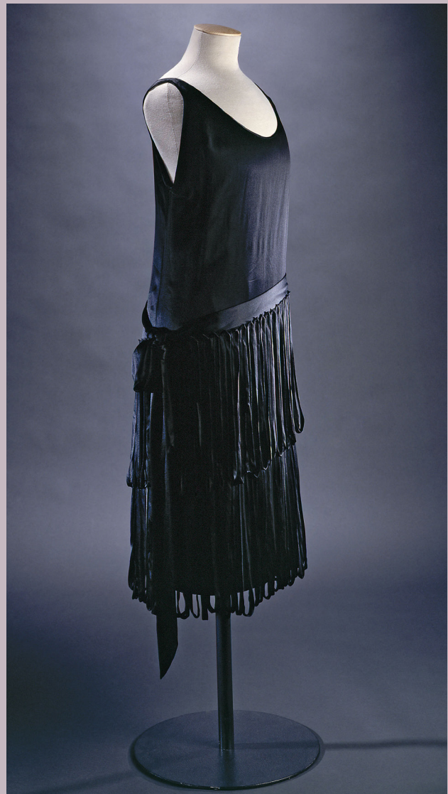
Jeanne-Marie Lanvin, Robe Neptune

Archétypal et physiologique, le noir forme un élément structurant mais ambigu de la représentation du sacré, à la fois couleur de tous les commencements, de l'infini, de l'intemporel mais aussi celle de la mort et de l'ignorance. La philosophie des Lumières, au 18 e siècle, dans sa lutte pour le triomphe de la Raison et la fin de l'obscurantisme a paradoxalement amené un regain d'intérêt pour l'étrange, la folie mais aussi la magie qui contribuent à l'émergence d'un romantisme noir durant tout le siècle suivant. La fin du 19 e siècle voit le développement d'un imaginaire décadent qui associe satanisme, sensualité, péché et mort (Rops, Doré). Mais, le noir infernal et maléfique se double d'un versant bénéfique et vénérable. Cette dualité de la couleur apparaît comme une manière poétique de conjurer le noir par le noir.