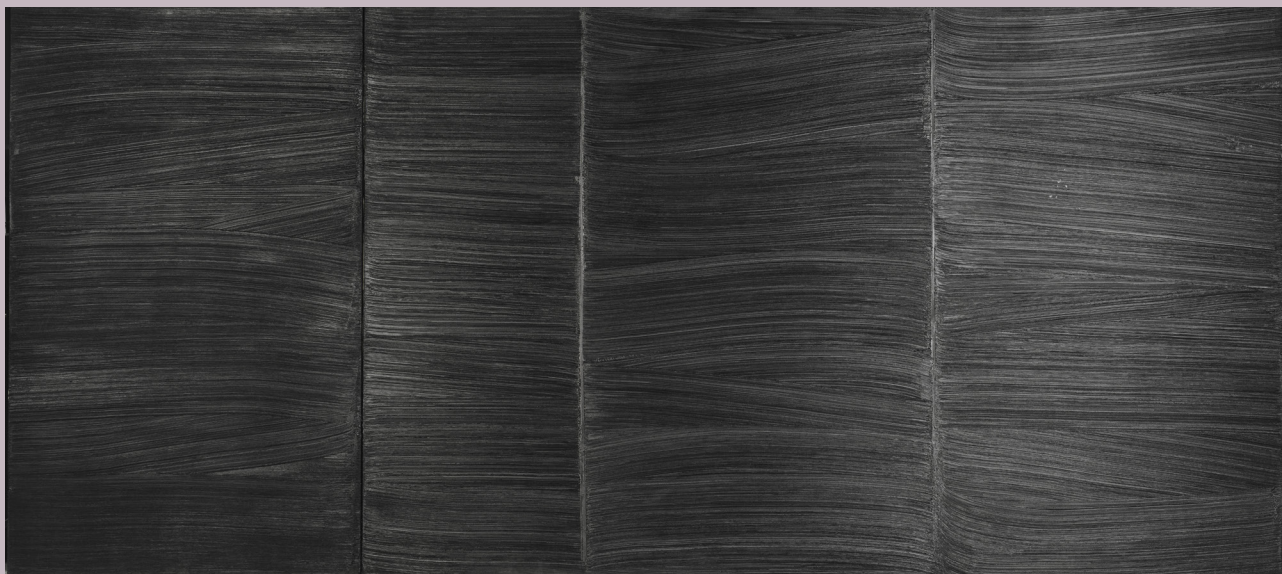
Pierre Soulages, Diptyque, 1979, huile sur toile HD

Au 20 e siècle, ce sont les plus grands créateurs de la haute couture qui vont à leur tour investir le noir.