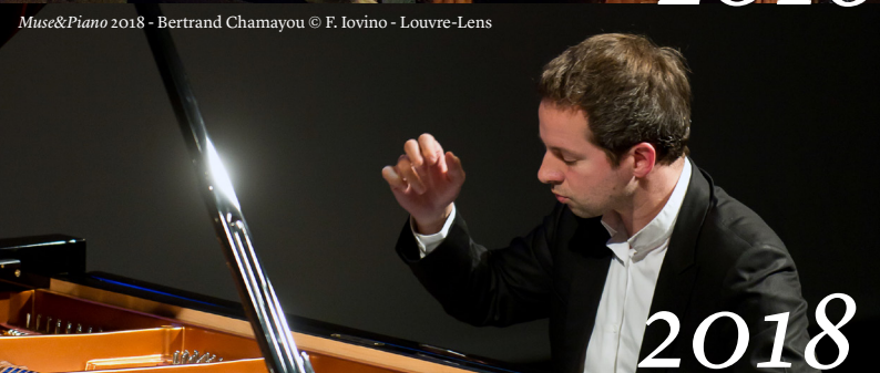
Muse&Piano 2018 - Bertrand Chamayou © F. Iovino - Louvre-Lens