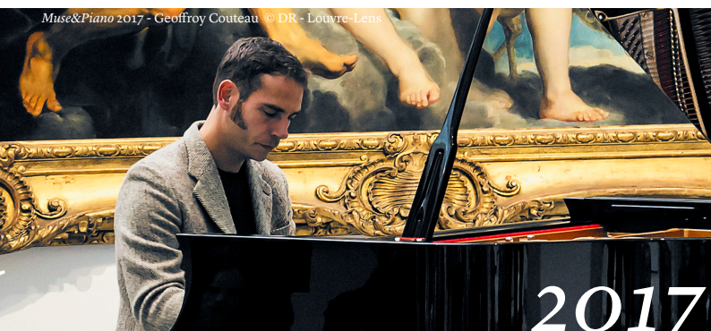
Muse&Piano 2017 - Geoffroy Couteau © DR - Louvre-Lens