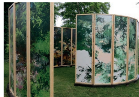
La fabrique de paysages, Bruno Desplanques