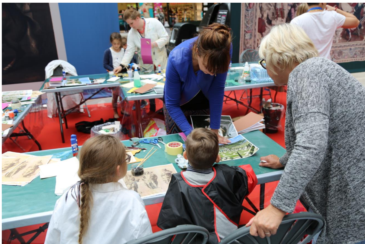
Le musée se délocalise dans la galerie commerciale Aushopping à Noyelles-Godault pour une semaine d'ateliers gratuits, sur les traces de Picasso dans le Paris des années 1900

L'ensemble des activités est gratuit, à découvrir ci-après.