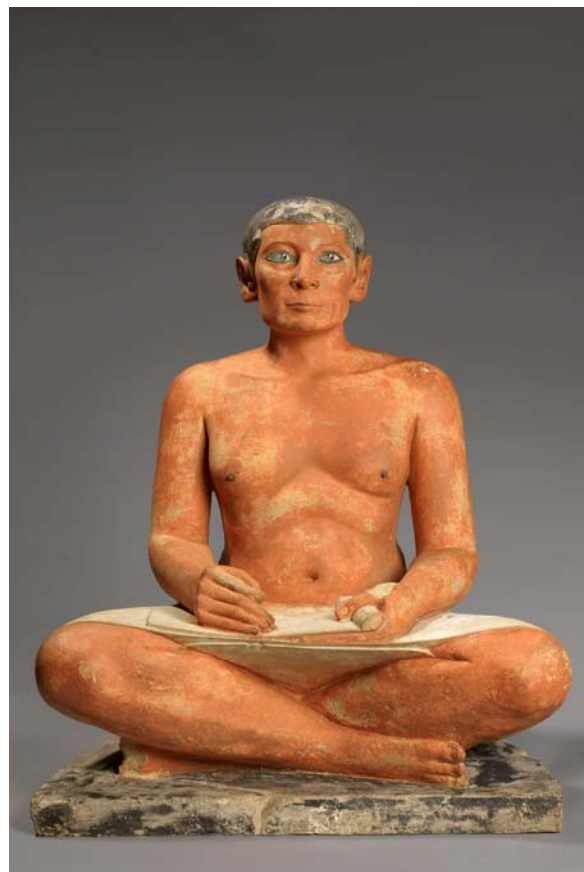
Le Scribe accroupi IVe dynastie. Calcaire, albâtre, cristal de roche h. 53,7 cm; L. 44 cm; p. 35 cm

Le Scribe représente un lettré ayant vécu il y a plus de 4 500 ans, prêt à écrire sur un papyrus posé sur ses genoux qu'il déroule de la main gauche. Il devait tenir dans sa main droite un calame, ce pinceau fait d'une tige végétale aujourd'hui disparu. La pierre calcaire a été peinte de couleurs vives pour rendre la sculpture vivante - noir pour les cheveux et le sol, brun pour la peau qui contraste avec le blanc du pagne dont il est vêtu. Mais c'est avant tout son regard particulier qui le rend si célèbre : le scribe se tient de face et semble fixer le spectateur avec intensité, l'iris de l'œil, formé d'un cône de cristal de roche poli, reflète la lumière donnant au regard l'impression d'un éclair de vie. Les paupières dessinées d'un trait de khôl sombre, soulignent les yeux qui miment à merveille la réalité, rendant la statue particulièrement captivante.