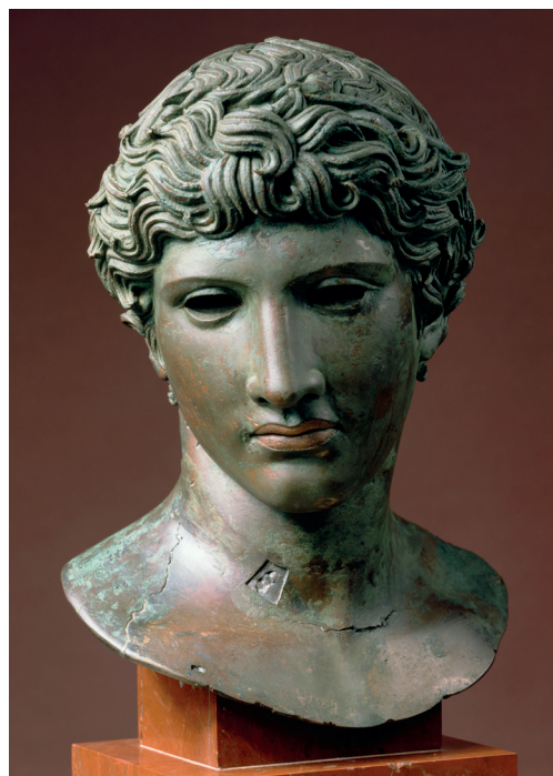
Tête dite de Bénévent. 50 av.-C. – 50 Musée du Louvre, département des Antiquités grecques, étrusques et romaines

Commissariat : Cécile Giroire, conservateur en chef du patrimoine, directrice du département des Antiquités grecques, étrusques et romaines du musée du Louvre. Martin Szewczyk, conservateur du patrimoine, département des Antiquités grecques, étrusques et romaines du musée du Louvre. Assistés de Florence Specque et Agnès Scherer, documentalistes au département des Antiquités grecques, étrusques et romaines du musée du Louvre. Scénographie : Mathis Boucher, architecte-scénographe du Louvre-Lens. La Fondation Crédit Mutuel Nord Europe est Grand mécène de l'exposition.