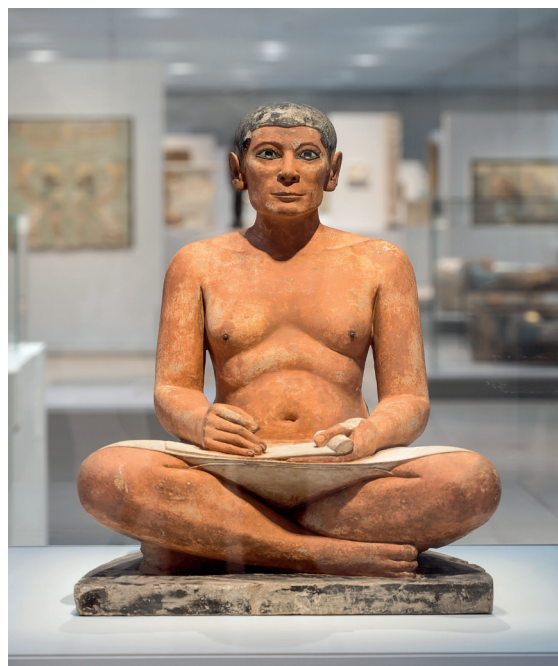
Le Scribe accroupi IV ème dynastie. Calcaire, albâtre, cristal de roche h. 53,7 cm; L. 44 cm; p. 35 cm

un promoteur déterminé du patrimoine archéologique de l'Égypte. Envoyé au Caire en mission par le Louvre en 1850, il se rend également à Saqqara et y dégage le Sérapéum, l'ancienne nécropole du taureau sacré Apis, ainsi que de nombreuses sépultures de particuliers. C'est probablement dans l'une d'elles qu'il trouve le fameux Scribe. La statue est offerte par l'Égypte au Louvre en 1854 au titre du partage de fouille, alors en vigueur, qui permet au découvreur de bénéficier de la moitié des trouvailles faites.