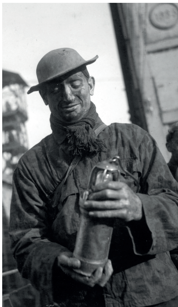
Mineur à la lampe - Lens, 1945

Surtout connu pour ses captures d'instantanés heureux de la vie quotidienne, Robert Doisneau, le plus célèbre des photographes français de l'après-guerre fut aussi un important témoin des conditions de travail des mineurs dont il avait su gagner la confiance. Aujourd'hui, cette exposition rend hommage à leur courage et leur engagement social pour la défense du droit de grève et l'amélioration des conditions de travail. Grâce à ces photographies chargées d'humanité, l'image de la mine et des mineurs retrouve ses couleurs.