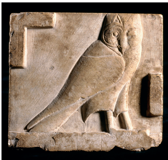
Modèle de sculpteur

“Je tiens l'affaire” ! se serait exclamé Jean-François Champollion (1790-1832) en mettant fin au mystère de l'écriture égyptienne le 14 septembre 1822. Grâce aux travaux de ses prédécesseurs et à l'étude approfondie de la Pierre de Rosette, découverte en 1799, le savant venait de lever le voile sur une écriture jusqu'alors restée inconnue. A l'occasion du 200 e anniversaire de son déchiffrement, et pour célébrer son 10 e anniversaire, le Louvre-Lens organise une grande exposition sur l'un des pans les plus fascinants de la civilisation égyptienne : les hiéroglyphes. Cette rétrospective ambitionne également de rendre hommage à l'un des plus brillants esprits du début du 19 ème siècle, qui fut le premier conservateur du musée égyptien du Louvre.