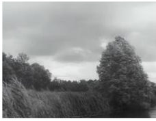
Partie de campagne Jean RENOIR 1946 © Les films du jeudi / les films du Panthéon