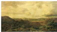
Les Gorges d'Apremont

Théodore ROUSSEAU (Paris, 1812 – Barbizon, 1867)