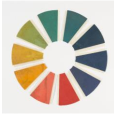
Dix éléments formant un cercle chromatique. Matériel d'enseignement au Bauhaus Vassily KANDINSKY 1922-1933 Aquarelle sur papier Paris, Centre Pompidou, Musée national d'art moderne-Centre de création industrielle

Pour aller plus loin : les artistes femmes dans l'histoire du paysage, l'art de faire tapisserie ?