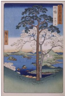
Série : Lieux célèbres des soixante et autres provinces ; Les collines d'Inaba