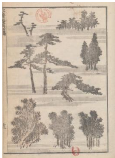
Hokusai manga Katsushika Hokusai, 1814-1878, Impression sur papier, Paris, Bibliothèque nationale de France, département des Manuscrits Japonais