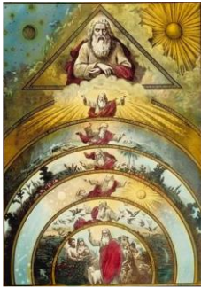
Plaque de projection : La Création du Monde