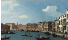
Vue du canal de Santa Chiara, à Venise