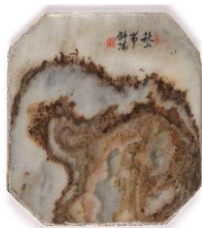
Pierre de rêve Entre 1644 et 1691 Marbre de Dali, Dijon, musée des Beaux-Arts