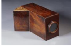
Chambre noire ou camera obscura portative

Jean-Baptiste PORTA (Vico Equense vers 1535 – Naples 1615)