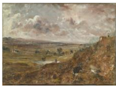
Vue de Hampstead Heath, environs de Londres, effet d'orage ou L'Étang de Branch Hill à Hampstead John CONSTABLE (East Bergholt, 1776 – Londres, 1837) Vers 1882 Huile sur toile, Paris, musée du Louvre, département des Peintures