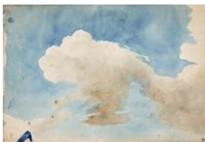
Nuages dans le ciel