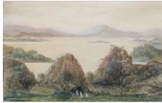
George SAND (Paris, 1804 – Nohant-Vic, 1876) 1860-1876 Aquarelle sur papier Paris, musée de la Vie romantique