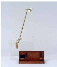
Chambre claire ou « camera lucida », Charles Chevalier Vers 1850 Laiton, verre, alliage ferreux Prêt du musée des Arts et Métiers – Cnam – Paris