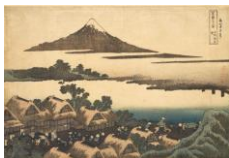
L'aube à Isawa (province de Kai) ; Série : Trente-six vues du Mont Fuji