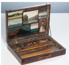
Boîte de peinture de Camille Corot avec sept petits tableaux à l'intérieur du couvercle Camille COROT (Paris, 1796 – 1875) 1822-1875 Huile sur bois La Haye, Pays-Bas, Kunstmuseum