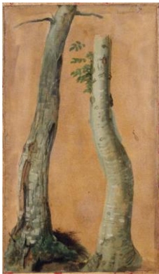
Etude de troncs d'arbres

François DESPORTES (Champigneulle, 1661 – Paris, 1743)