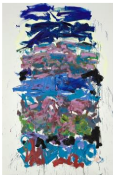
Champs Joan MITCHELL (Chicago, 1925 – Paris, 1992) 1990, huile sur toile Paris, Centre Pompidou, Musée national d'art moderne-Centre de création industrielle