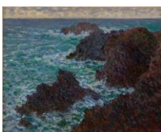
Les rochers de Belle-Île, la Côte sauvage