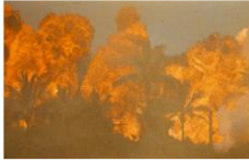
Apocalypse Now Francis Ford Coppola 1979