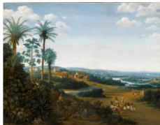
« La demeure d'un labrador » ( planteur de canne à sucre), dit auparavant Le Village de Serinhaem (en Pernambouc) Frans POST (Leyde, 1612 - Haarlem, 1680) 1650-1655 Huile sur toile Paris, musée du Louvre, département des Peintures