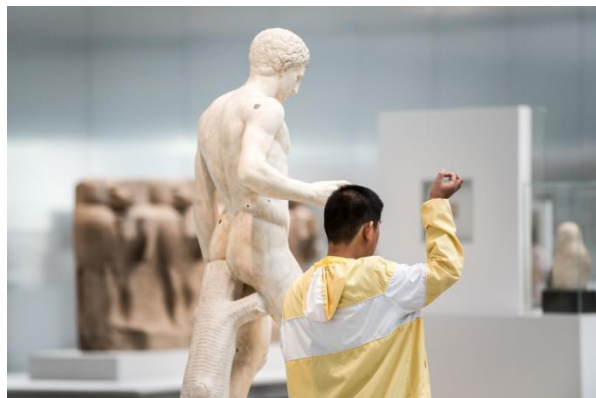
Rendez-vous pour des visites chantées ou thématiques en Galerie du temps