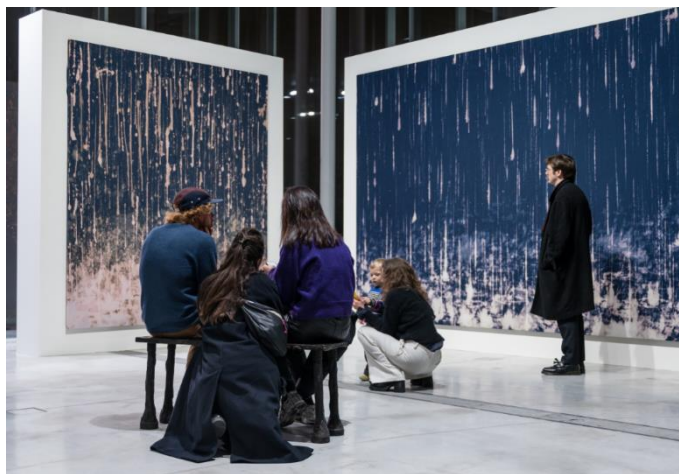
« Louvre toi-même » : un documentaire qui retrace l'aventure inédite de l'exposition participative « Intime et moi »