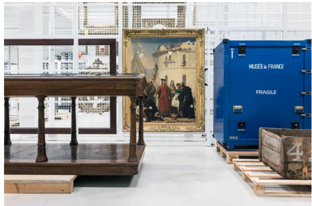
Immersion dans les réserves du Louvre-Lens

Inscription sur place, le jour-même, dans la limite des places disponibles