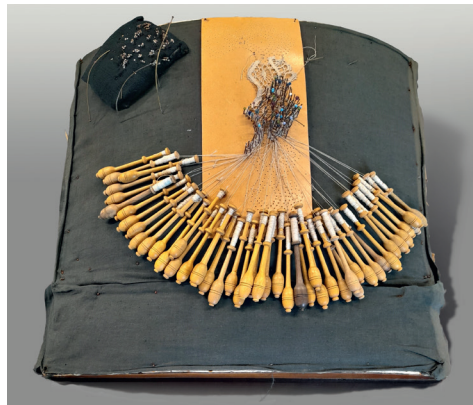
Carreau de type flamand, 1850-1950