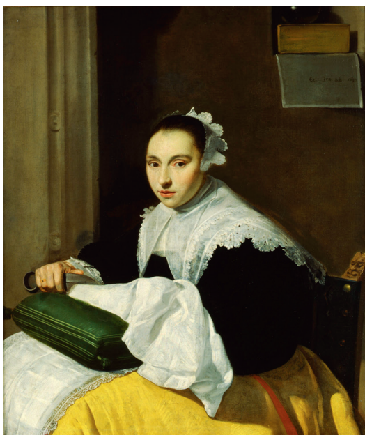
La Couturière, anonyme, 1633

Comme un écho contemporain, l'exposition accueille les œuvres récentes de Raphaël Barontini , Safâa Erruas , Hessie et Annette Messager . Avec humour parfois, pertinence toujours, elles interrogent le temps de Vermeer et de sa Dentellière .