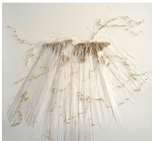
Rutas , Safâa Erruas, 2021 © courtesy de la Galerie Dominique Fiat