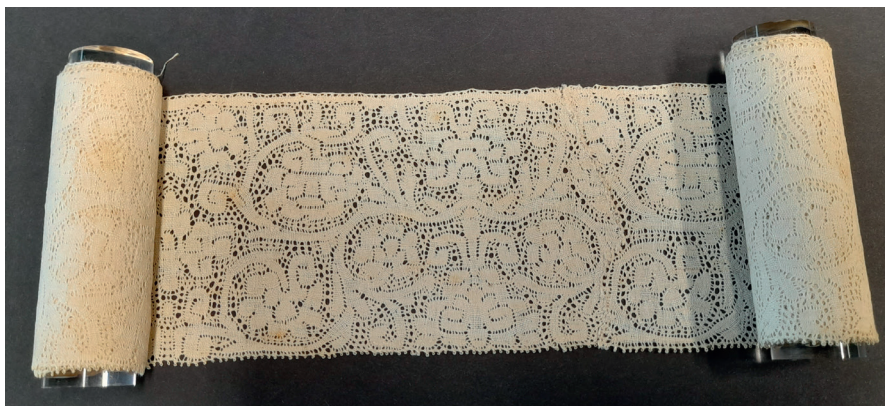
Bande de dentelle, 1600-1700

Malgré sa complexité, sa lenteur de réalisation, et donc un coût élevé, la dentelle est un incontournable de la garde-robe de prestige du 16 e au 18 e siècle. À l'époque de Vermeer, elle est principalement employée pour les cols, l'extrémité des manches ou les mouchoirs. Assemblage de motifs ornementaux, elle suit les modes et entraîne la publication de patrons.