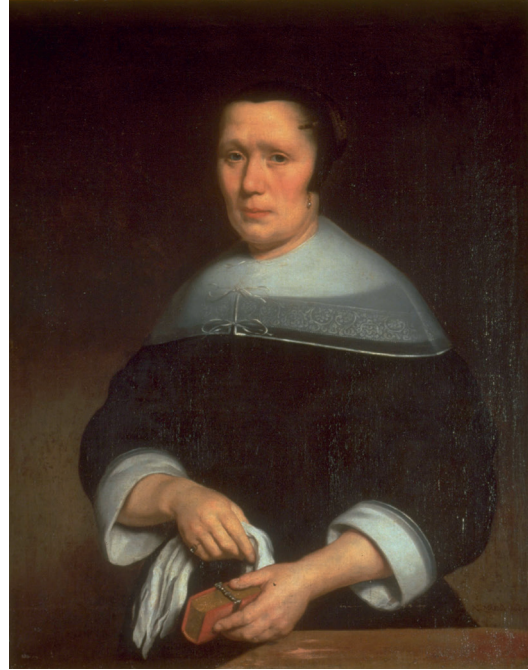
Portrait de femme , Nicolas Maes, 1667

Les fuseaux sont des bobines de bois que La Dentellière saisit entre ses doigts. La dentelle s'exécute sur un petit métier appelé carreau, sur lequel un parchemin dessiné est épinglé. Le dessin indique la position des épingles et détermine le motif à reproduire. Les fuseaux servent à manier les fils sans les emmêler ni les salir. Un tiroir placé sous le plan de travail protège l'ouvrage au fur et à mesure qu'il est réalisé. Les fils sont généralement constitués de lin, une plante dont la culture est fortement développée dans les Provinces-Unies (Pays-Bas actuels).