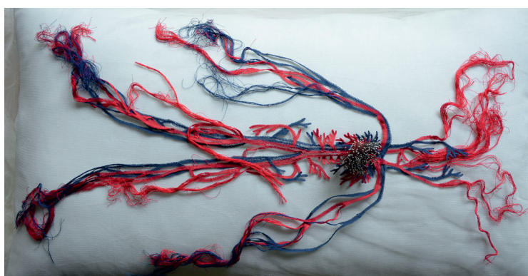
Pénétration , 1997, Annette Messager