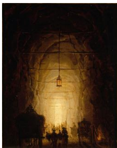
La grotte de Pausilippe à Naples Huile sur toile Hubert ROBERT 1760-1761 Petit Palais, musée des Beaux-Arts de la Ville de Paris