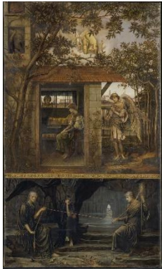
Le fil d'or (A Golden Thread) Huile sur toile John Melhuish STRUDWICK 1875 Tate