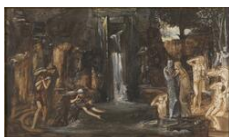
La Fontaine de jouvence Aquarelle Edward BURNE-JONES 1873-1881 Tate