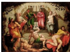
La Grotte de Platon