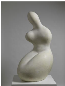
Demeter Statue en plâtre Jean ARP 1961 Centre Pompidou, Paris