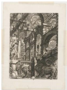
Série: Les Prisons