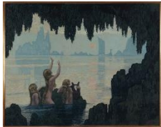
Chants sur l'eau Huile sur toile Jean-Francis AUBURTIN 1912 Petit Palais, musée des Beaux-Arts de la Ville de Paris