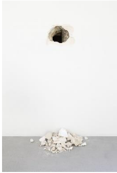
La Caverne de Platon Huang YONG PING 2009 © Adagp, Paris, 2024