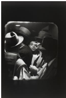
Odd Man In. De la Série "Penn Station" ((Homme impair inclus)) Tirage photographie Louis STETTNER 1958 Centre Pompidou, Paris