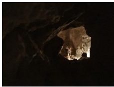
La Caverne de Platon