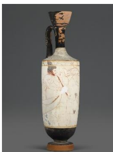
Lécythe : Charon dans sa barque