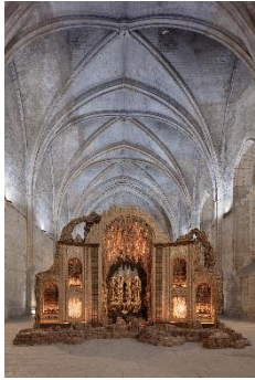
Nymphées Installation Eva JOSPIN © Adagp, Paris 2024 © Atelier Eva Jospin / Benoît Fougeirol