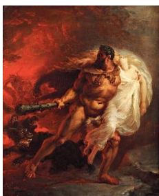
Hercule arrachant Alceste des Enfers