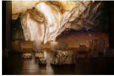
Hyperphantasia, des origines de l'image Installation vidéo Justine EMARD 2022