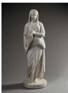
La Sibylle d'Erythrée