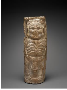
Sculpture représentant Ah-Puch, dieu de la mort