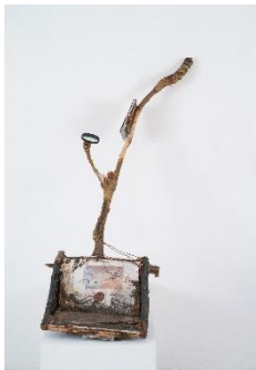
Reading Shovel Installation Laure PROUVOST 2015 © Laure Prouvost, ADAGP 2024