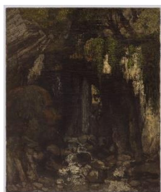
Vue de la caverne des géants près de Saillon, ou Paysage fantastique aux rochers anthropomorphes